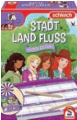
Schleich - Horse Club Spiel, Stadt Land Fluss